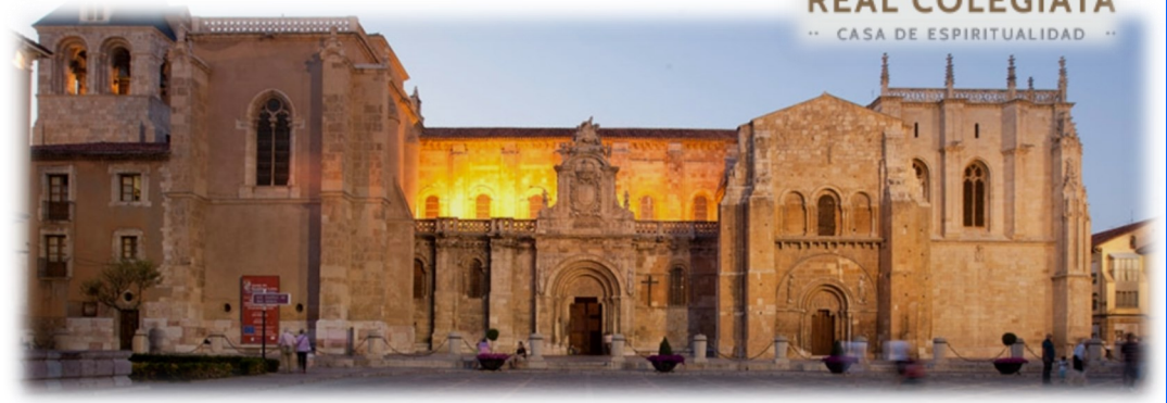
HOTEL REAL COLEGIATA CASA DE ESPIRITUALIDAD

Desayuno y salida dirección Ponferrada, capital de la comarca del Bierzo, el casco histórico se extiende a los pies de un imponente Castillo fundado por los templarios, al que se entra por la Calle del Reloj , Junto a la Torre del Reloj se sitúa el Convento de las Madres Concepcionistas , El final de esta calle conduce a la Plaza de la Encina, tradicional lugar de transacciones comerciales. En ella se levanta la Basílica de la Encina , uno de los edificios religiosos más destacados de la ciudad. Almuerzo . Regreso a la ciudad de origen y FIN DEL VIAJE Y DE NUESTROS SERVICIOS .